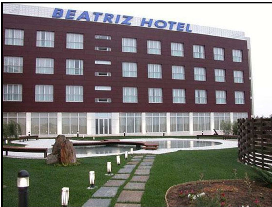
Hotel**** Beatriz Albacete.

Los precios que se han negociado con el hotel son los siguientes: