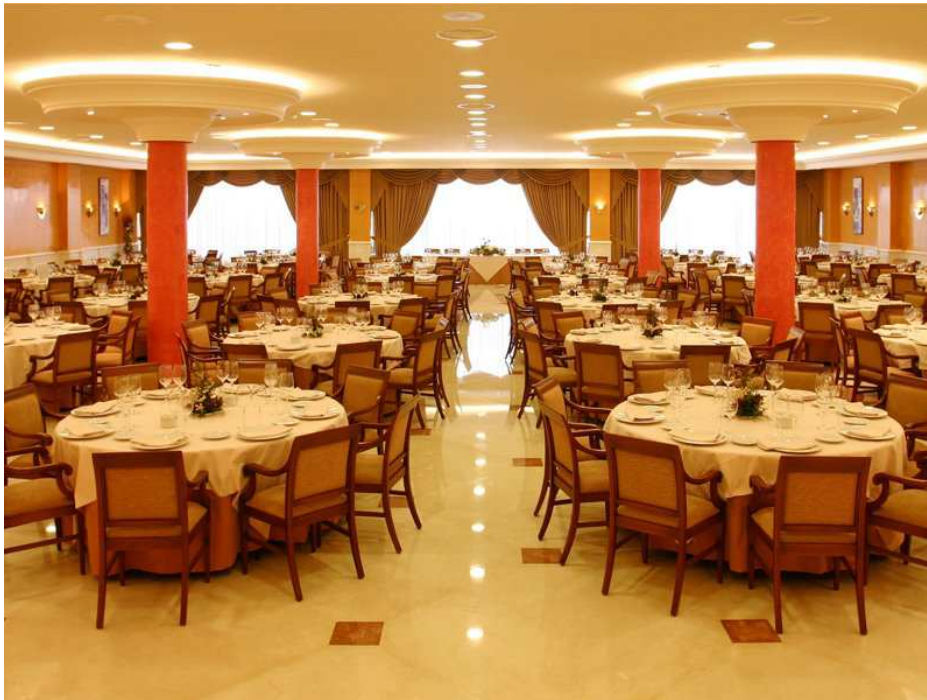
Vista del salón donde se disputará el evento.

La sede oficial del torneo será el Sercotel Hotel Guadiana, situado en la C/ Guadiana, 36, Ciudad Real. El teléfono para hacer las reservas es el 926 22 33 13 o en el correo info@hotelguadiana.es .